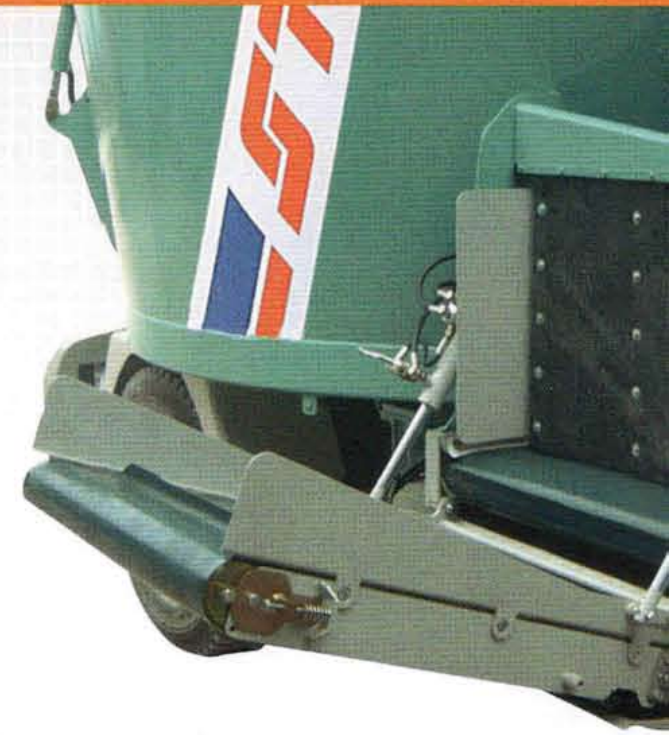
Discharge conveyor with side-shift Transportador de descarga móvil