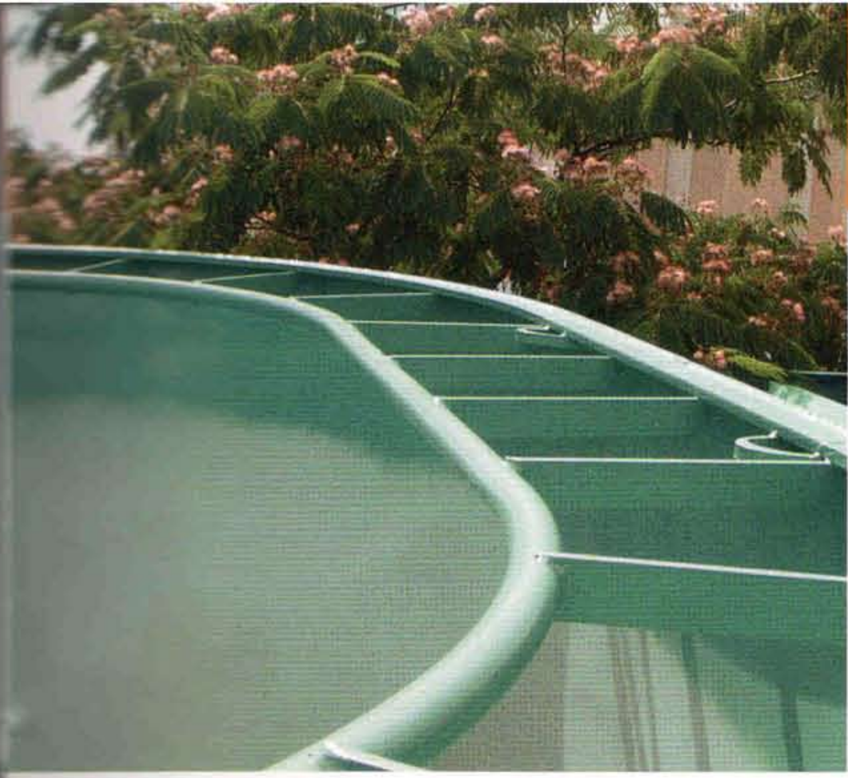
Straw ring Anillo de retención del forraje