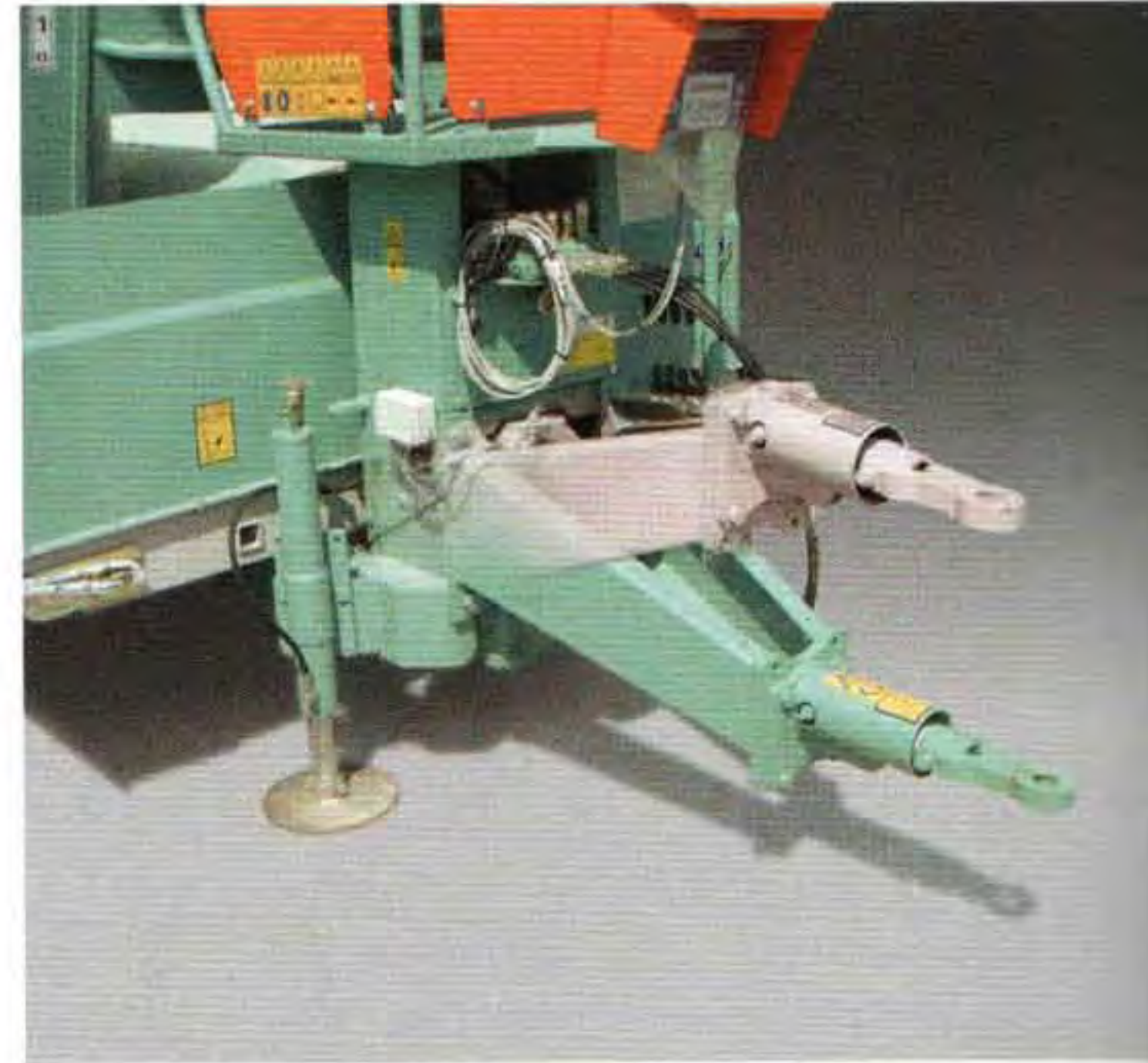
Adjustable drawbar Timón de altura regulable en diferentes posiciones

En las granjas, el mezclador vertical puede ser una solución para muchos problemas: garantiza la capacidad de elaboración de cualquier componente de uso común, incluso pacas redondas enteras. Garantiza además un mezclado siempre suave, una frecuencia de mantenimiento muy reducida, una capacidad y velocidad de corte elevadas con raciones ricas de forraje, así como una larga duración de las cuchillas. Todas estas características hacen que los Dunker sean aptos para la alimentación de vacas de leche, vacas secas, terneras, ovejas, cabras y búfalas. La posibilidad de escoger entre 3 capacidades desde 8 hasta 12 m 3 garantiza un mezclado de óptima calidad con cualquier número de cabezas de ganado.